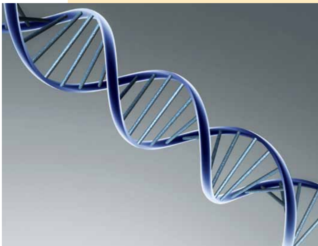
Illustratie van DNA-streng

D e orthopedisch specialist van de universiteit in Utrecht vindt dat KNGF Geleidehonden de gezondste labradors heeft als het gaat om de heupen. En ook het percentage honden met elleboogdysplasie ligt ruimschoots lager dan het landelijk gemiddelde. Jarenlange klinische en röntgenologische screening werpt zijn vruchten dus af. Toch zijn erfelijke aandoeningen op die manier nooit voor 100% weg te fokken. De genen die verantwoordelijk zijn voor heup- en elleboogaandoeningen blijven opgeslagen in het genetisch materiaal van de dragende ouders. Bij de nakomelingen kan het dus altijd weer de kop opsteken. Het volledig uitroeien van erfelijke aandoeningen kan wel als je gebruik maakt van DNA-testen. Deze testen geven uitsluitel of een hond lijder, drager of vrij is van