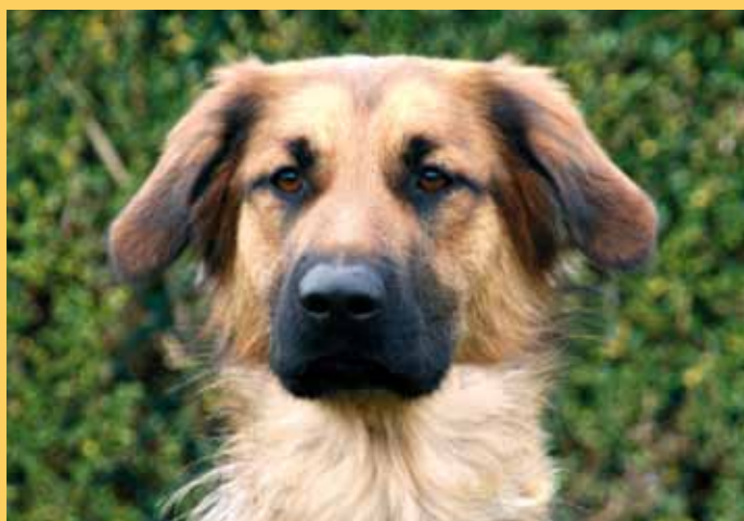
KRUISING DUITSE HERDER/GOLDEN RETRIEVER